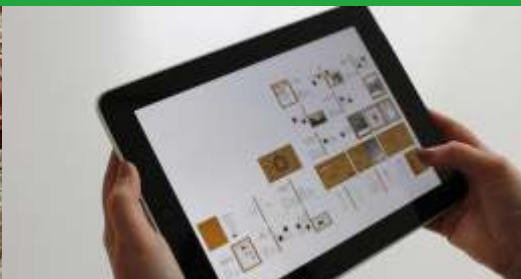
Niedersachsen fördert Digital Hub in Holzminden