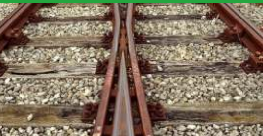
Umsteigen statt Aussteigen