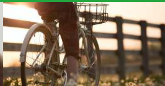
Weser-Radweg auf Platz zwei