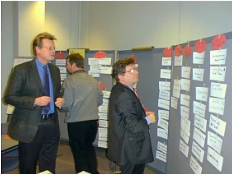
Schwerpunktsetzung in der AG 3